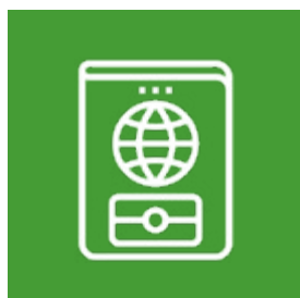
Passeport Copies de toutes les pages tamponnées, visas et écrites

Tout autre document nécessaire à l'instruction pourra vous être demandé par la Préfecture.