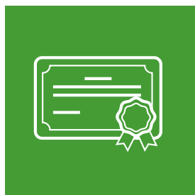
Dernier diplôme obtenu en France ou Attestation de réussite (si disponible)