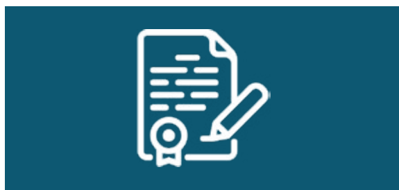
Attestation du directeur de thèse Doit mentionner l'avancement dans la thèse et la date prévue de soutenance . (Document récent avec en-tête, signature et tampon) >> Si vous étiez précédemment étudiant en Master ou 5ème cycle ingénieur, fournir les relevés de notes des 2 semestres et 2 sessions.