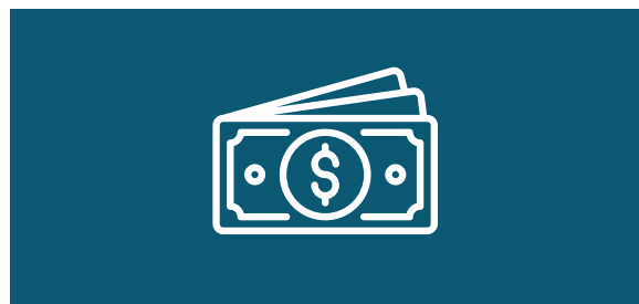
Justificatifs de ressources 615€ par mois ou 6150€ par an

≥ Si vous êtes pris en charge par une personne, il faudra fournir en plus :