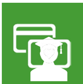
Carte étudiant Copie de la carte de l'année universitaire en cours