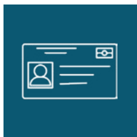
Titre de séjour ou Visa + validation du visa