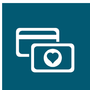
L'ancienne Carte Vitale ou attestation de sécurité sociale (si déjà enregistré)