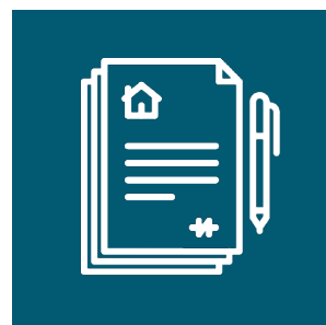
Justificatif de présence en France depuis plus de 3 mois (factures ou attestation de résidence, contrat de location à votre nom etc...) + un justificatif de domicile récent.